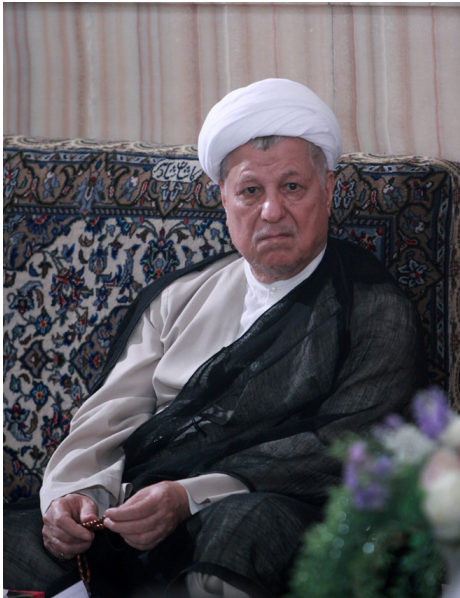
احمدی نژاد صاف نشد.

جهت گیری سیاسی این سایت، حمایت از دیدگاه های سیاسی و عملکرد اکبر هاشمی رفسنجانی و حسن روحانی است. این سایت در انتخابات ریاست جمهوری سال ۹۲ یکی از حامیان جدی حسن روحانی بود و پس از آن نیز یکی از مبلغان و طرفداران اصلی دولت یازدهم محسوب می شود و در واقع می توان این سایت را جدی ترین سایت حامی دولت یازدهم دانست که به صورت سازمانی نیز بسیاری از اعضای آن مرکز تحقیقات استراتژیک مجمع تشخیص و حزب اعتدال و توسعه بوده اند.